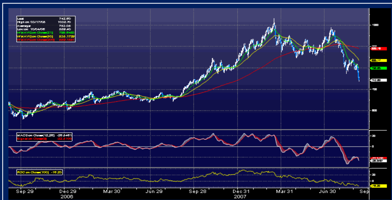
GRAFICO 4 – ORO vs DOLARES

Nuestra opinión es que la contención de los agregados monetarios en los Estados Unidos, Europa y Japón ha sido tanto más fuerte que el déficit fiscal americano creciente. La oficina del tesoro informó que sus estimados para el año 2008 llegan a aproximadamente 400 billones de dólares de déficit. El gobierno japonés para paliar la recesión de su economía anunció un programa de 107 billones de dólares en gasto fiscal. Como se puede apreciar el fuerte incremento de los déficit fiscales, -que al fin del día son otra forma de emisión pero a diferencia de los bancos centrales, dinero emitido pero con remuneración-, no ha servido para darle soporte al oro. La contracción del oro se está dando contra las tres grandes monedas al mismo tiempo, como se puede apreciar en los gráficos adjuntos, donde vemos al oro medido en dólares, en euros y en yenes.